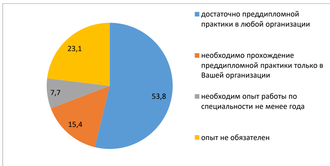
Рис. 3 – Вопрос 2. Обязательно ли выпускник вуза должен иметь опыт практической работы, прежде чем он придет устраиваться на работу в Вашу организацию?

Анализируя требования предъявляемые респондентами к соискателям (Рис. 3), можно сделать вывод, что для 23,1% опрошенных опыт практической деятельности не имеет значение, 15,4% - отдают предпочтение соискателям, прошедшим преддипломную практику в организации, и лишь 7,7% предъявляют требования к стажу практической деятельности по специальности. Следовательно, более 80% респондентов готовы принимать выпускников на работу.